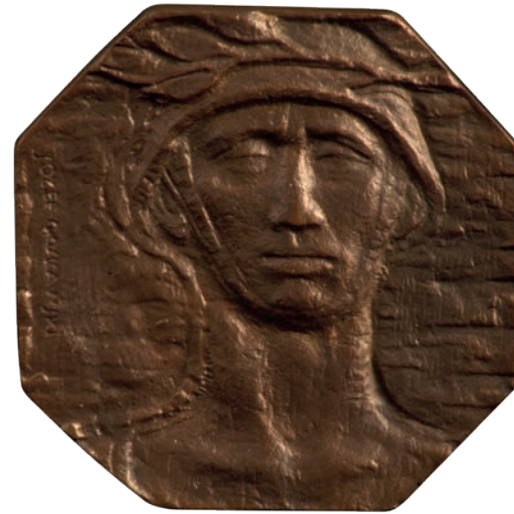
Fotografia 12. Medal Westerplatte II . 15-lecie obrony Westerplatte, 1954 r. , (awers). Fot. Piotr Jamski. Ze zbiorów prywatnych rodziny Józefa Gosławskiego