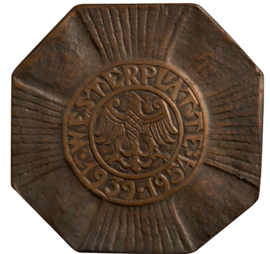
Fotografia 13. Medal Westerplatte II . 15-lecie obrony Westerplatte, 1954 r. , (rewers). Fot. Piotr Jamski. Ze zbiorów prywatnych rodziny Józefa Gosławskiego