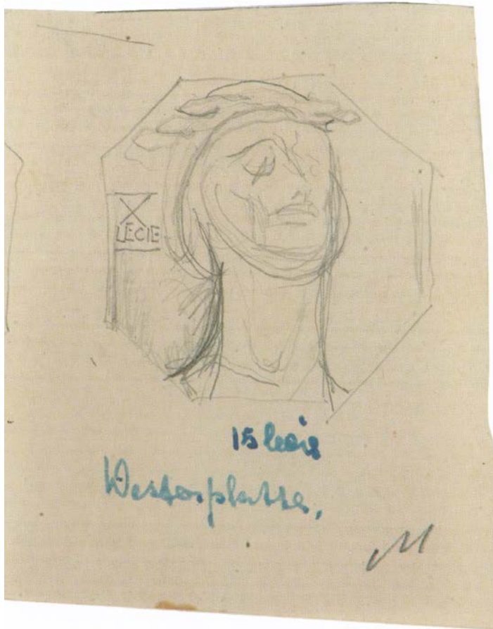
Fotografia 11. Szkic medalu Westerplatte II . 15-lecie obrony Westerplatte . Fot. Piotr Jamski. Ze zbiorów prywatnych rodziny Józefa Gosławskiego