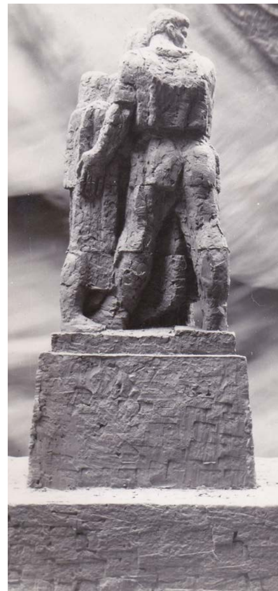
Fotografia nr 2

Model ostatniej wersji pomnika Nigdy wojny znajdujący się na terenie byłego niemieckiego nazistowskiego obozu karno-śledczego w Żabikowie, 1956 r.