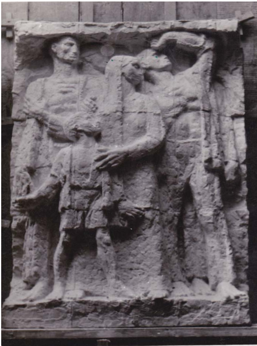
Fotografia nr 3

Płaskorzeźba stworzona przez Józefa Gosławskiego do pierwszego modelu pomnika Nigdy wojny . 1955 r.