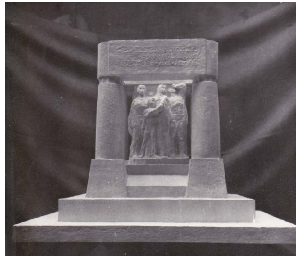
Fotografia nr 4

Płaskorzeźba stworzona przez Józefa Gosławskiego do pierwszego modelu pomnika Nigdy wojny . 1955 r.