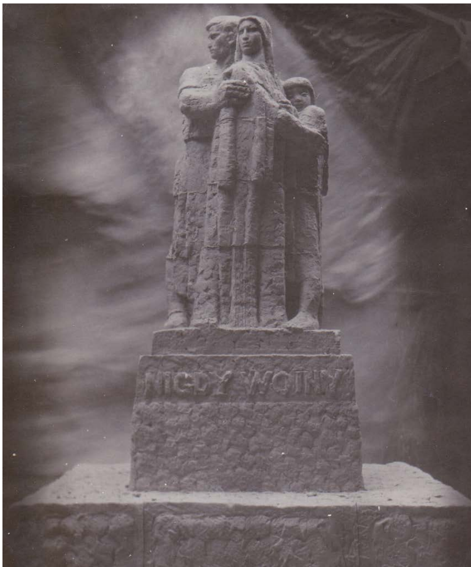
Fotografia nr 1

Model ostatniej wersji pomnika Nigdy wojny znajdujący się na terenie byłego niemieckiego nazistowskiego obozu karno-śledczego w Żabikowie, 1956 r.